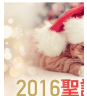
【專頁 · 2016 聖誕

熱門 萬千星輝頒獎典禮 李佳芯 張穎康 致命復活 葉劉淑儀 宋智孝 Running Man