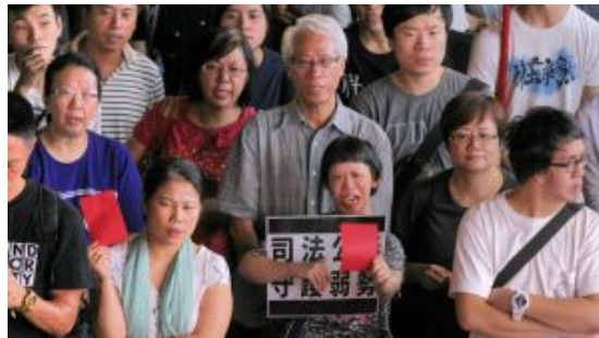
讓康橋悲劇不再 以「狗智」克服犬儒