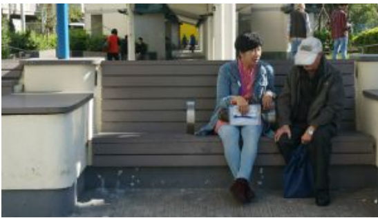
【長者看病難】輪候社署服務需時10月 街坊自發義務陪診