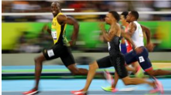
【圖輯】路透社2016年十一張精彩作品 攝影師親身剖白背後故事