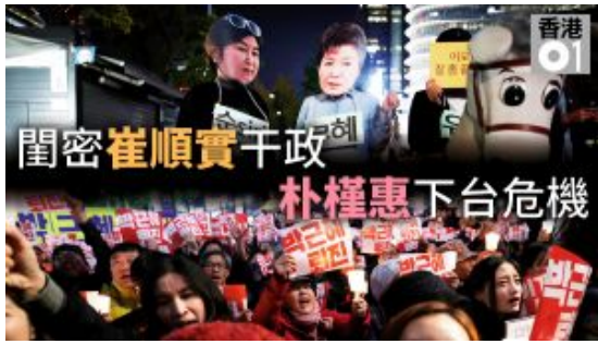
【朴槿惠遭彈劾】解讀崔順實干政黑幕：異端教派、神秘的三星