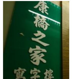
【康橋性侵案】社福之家79院友受影響