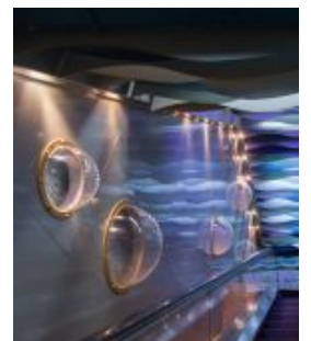
【社區影像】水族「室內金魚街」變