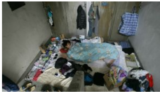
社會福利制度為誰服務——無權弱勢者？繁榮得益者？