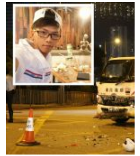
【專頁：速遞員之】讀照顧癌父 揭行