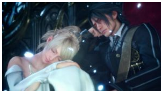
【Final Fantasy XV 攻略專區】FF15 干