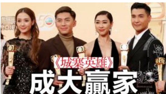
【萬千星輝頒獎典禮】《城寨英雄》奪