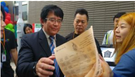
路德會行政總裁月薪最高10萬 社福工會向社署抗議肥上瘦下