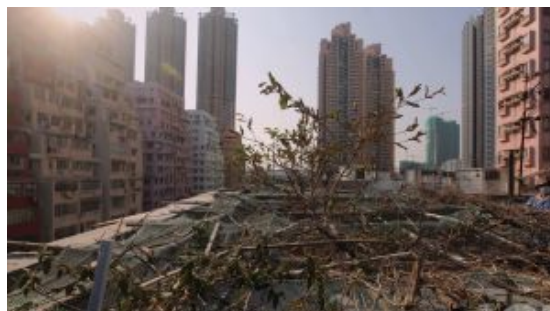
【圖輯】涉168戶半為劊房 市建局大角咀重建項目的面貌