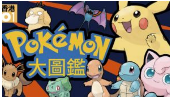
【01道館】Pokemon Go全攻略：升級、圖鑑、新聞結集