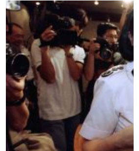
【特首選戰·圖輯】員 再競逐特首