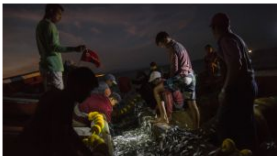
【國際影像】糧食短缺 委內瑞拉海盜四起 漁民組織自衛隊防衛