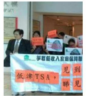
【來稿】受惠人數少 津計劃五大問題