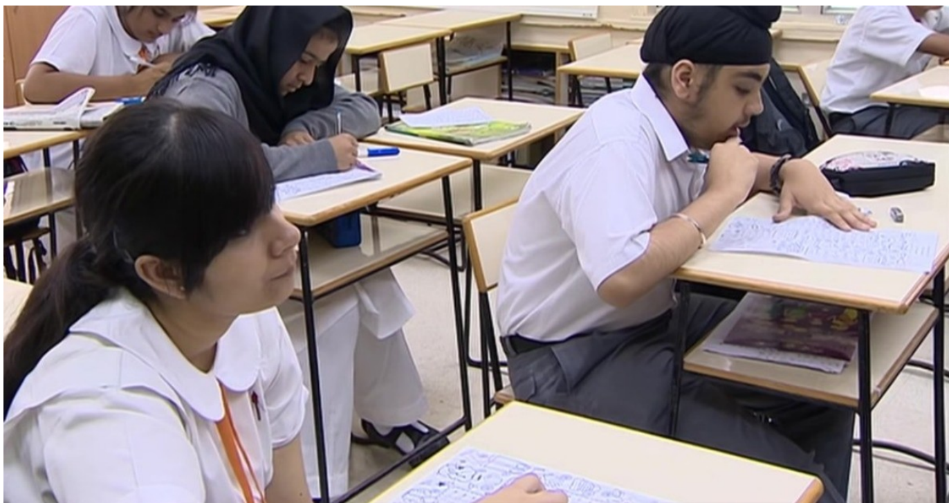
少數族裔學生

平機會一月中發表《香港主流學校教育少數族裔學生所面對的挑戰之研究》，說法與融樂會一直以來的倡議吻合：教育局現行教授非華語學生的「中文作為第二語言學習架構」不切實際、教師培訓空談理論。雖是舊酒新瓶，仍不啻賞了教育局狠狠一巴掌。