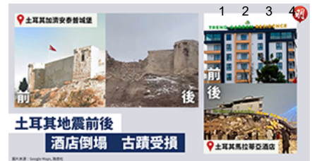
土耳其地震千年古堡受損 酒店倒塌只剩招牌【附互動對比圖】

香港融樂會在3至4月的調查中，指937名受訪者中，近5成人失業，比香港同期失業率的5.4%，高近10倍。融樂會認為疫情導致少數族裔的貧窮問題加劇，逾5成受訪少數族裔處於2020年貧困線以下。