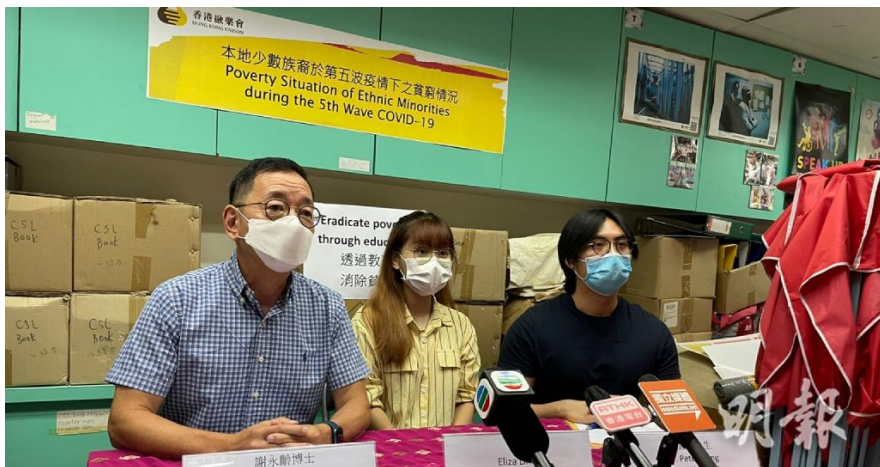
圖1之1-香港融樂會公布調查結果，近半受訪少數族裔於3至4月失業。