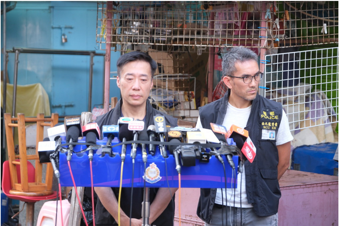
西九龍總區刑事部警司鍾雅倫（左）