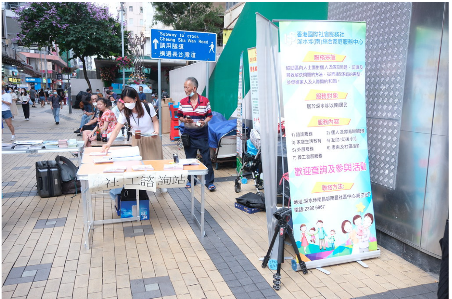
#桂林街 #謀殺 #深水埗 #獨媒報導