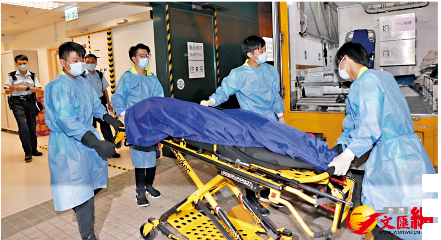
女童遺體由仵工舁送殮房。

根據統計處2021年人口普查《主題性報告：少數族裔人士》資料顯示，本港少數族裔人約30萬，過去10年，香港的少數族裔人口更上升七成。但少數族裔基於言語隔閡，不太主動，或者不熟悉求助方法，故全港24間精神健康綜合社區中心（ICCMW）當中，2017至2018年少數族裔使用率不足1%。