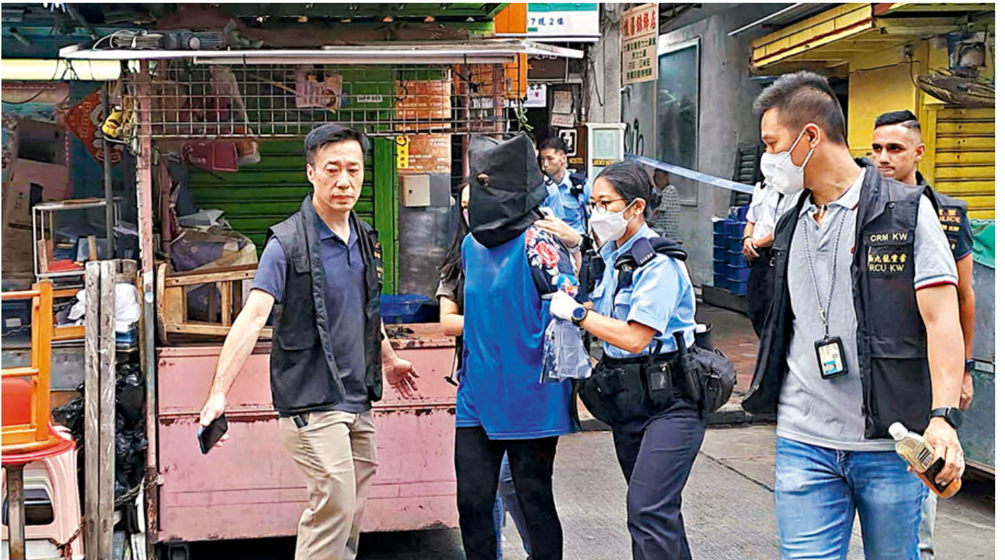
桂林街謀殺案疑兇被拘捕。

(香港文匯報記者 文森、蕭景源) 香港社會市民精神健康問題再敲起警號！一名居港的印度裔母親疑不堪婚變及獨力照護3名年幼女兒的精神壓力，昨晨在深水埗劏房寓所疑用枕頭一焗死3名年僅2歲至5歲的女兒，再致電通知家人揭發事件。該家庭之前有社工跟進，後因家改由新的綜合家庭中心跟進。今次慘劇再次揭露香港少數族裔面對生活困境，情緒、社會及人際支援不足的老大難問題。根據數據，過去十年香港的少數族裔人口上升七成，但全港24個精神健康綜合社區中心，但不足1%的服務使用者是少數族裔，反映少數族裔的問題家庭甚為隱蔽。學者呼籲政府聘用更多「同聲同氣」的少數族裔人士當義工，主動接觸有需要人士。