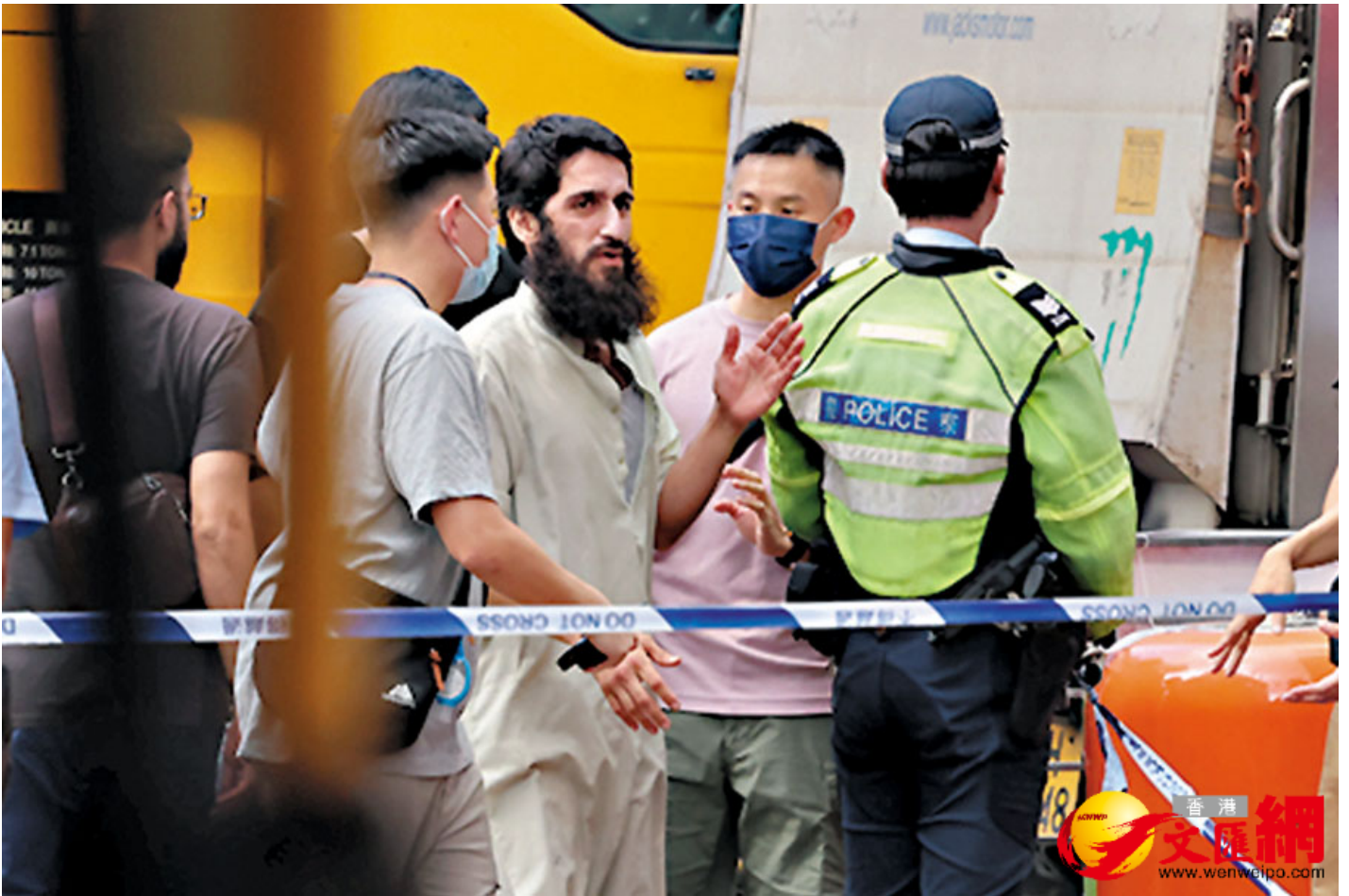
三女童的父親。

在飽受婚變打擊及要獨力照護3名女兒壓力下，分居妻情緒瀕臨崩潰。雖然沒有精神病紀錄，但據了解，涉案母親兩年前誕女後情緒不穩，曾接受包括精神科在內的會診。有消息指，她因擔心失去3名女兒撫養權，近日被家人發現不時喃喃自語，甚至向家人聲稱「被鬼跟」，懷疑精神出現異常。